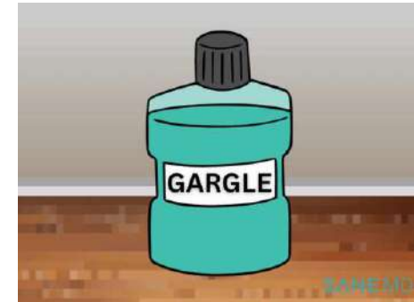
Rīkles skalošanas līdz.