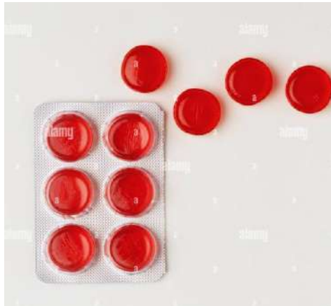
Sūkājamās tabletes/pastilas / dražejas